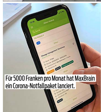
Für 5000 Franken pro Monat hat MaxBrain ein Corona-Notfallpaket lanciert.

rialien und interaktive Plattformen sind wichtiger als eine physische Präsenz im Klassenzimmer.