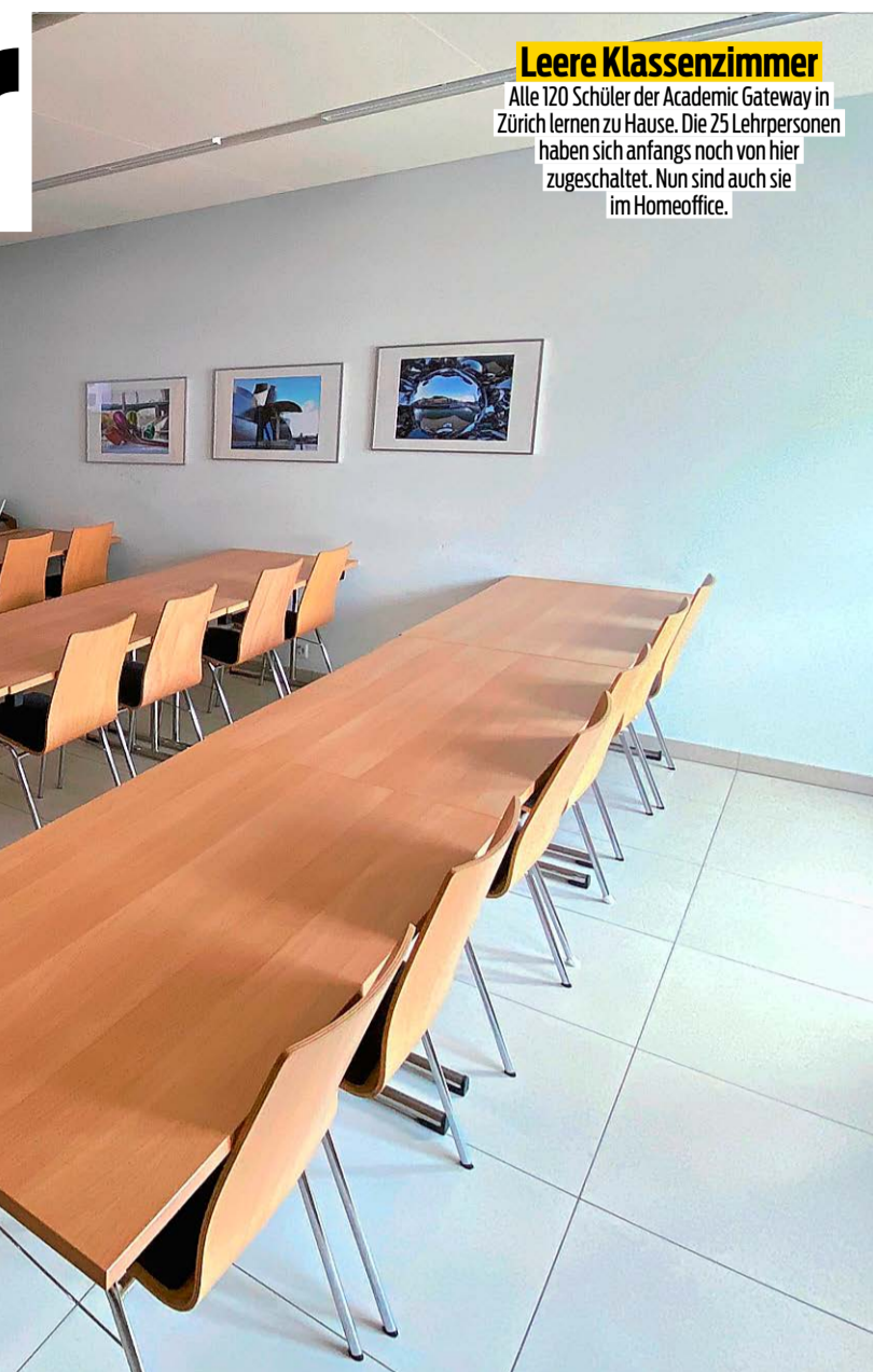
Leere Klassenzimmer Alle 120 Schüler der Academic Gateway in Zürich lernen zu Hause. Die 25 Lehrpersonen haben sich anfangs noch von hier zugeschaltet. Nun sind auch sie im Homeoffice.