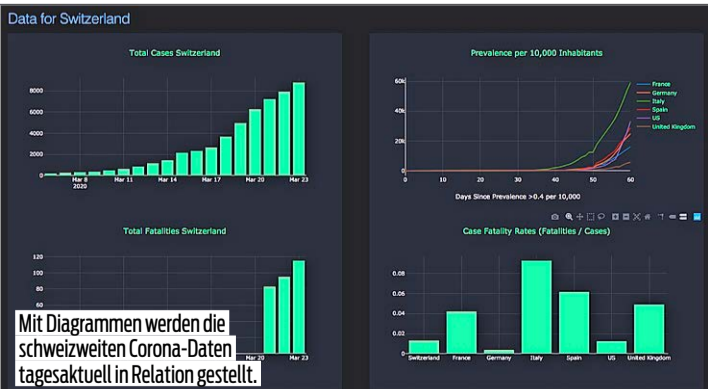
Mit Diagrammen werden die schweizerischen Corona-Daten tagesaktuell in Relation gestellt.

Er hat dem BAG angeboten, seine Plattform zu nutzen. Eine Rückmeldung gab es nicht. Doch Probst will weiterhin den «Informationsdurst der Bevölkerung stillen». Sein nächstes Corona-Projekt: die Auslastung der Spitalbetten in der Schweiz. Das Problem daran: Noch gibt es dafür zu wenig tagesaktuelle Daten. DOMINIQUE RAIS