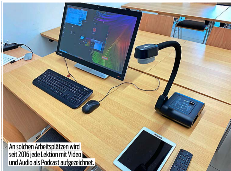
An solchen Arbeitsplätzen wird seit 2016 jede Lektion mit Video und Audio als Podcast aufgezeichnet.