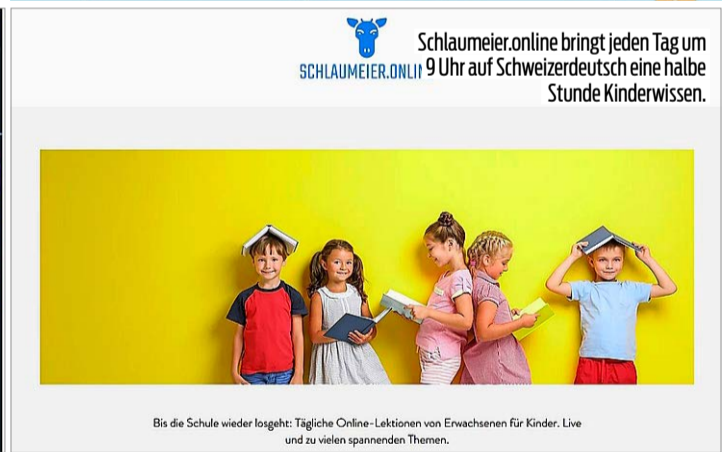
Schlaumeier.online bringt jeden Tag um 9 Uhr auf Schweizerdeutsch eine halbe Stunde Kinderwissen.