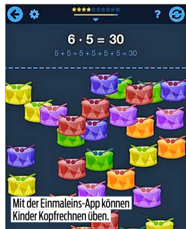
Mit der Einmaleins-App können Kinder Kopfrechnen üben.