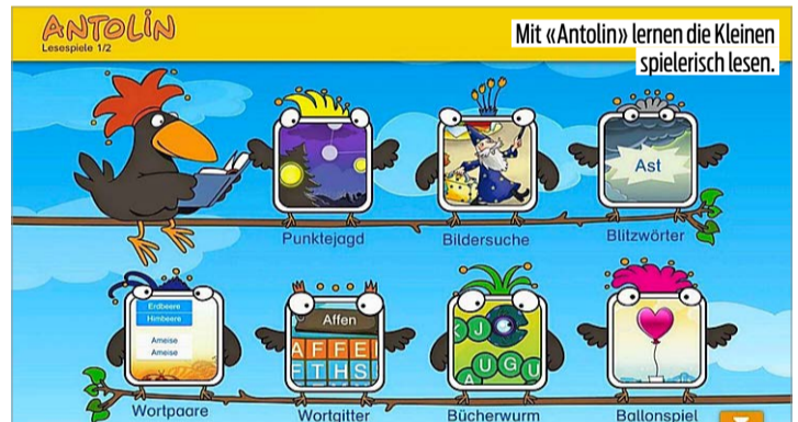
Mit «Antolin» lernen die Kleinen spielerisch lesen.

Viele Apps bringen Kindern spielerisch Programmieren bei. Empfehlenswert ist «Scratch». Das Massachusetts Institute of Technology hat die Gratis-Plattform für Kinder von 8 bis 16 Jahren entwickelt. Sie können Games oder Animationen programmieren und lernen die Grundlagen der Informatik kennen. Es gibt Apps für Windows, Mac und Android. Der Ableger für noch jüngere Kinder heisst «ScratchJr». LORENZ KELLER